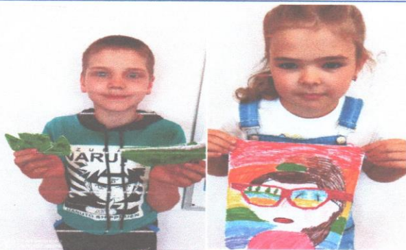
На фото работы детей по программам кружковой деятельности

Лето – это не только период активного отдыха учащихся, но и дополнительные возможности для педагогов по привлечению учащихся в свои объединения, а также для поиска новых идей и возможностей их реализации в следующем учебном году. Создание краткосрочных образовательных программ имеет позитивный педагогический смысл: Для обучающихся – это возможность погрузиться в уникальную творческую атмосферу дополнительного образования, попробовать себя в разных видах деятельности. Для родителей – это возможность понять преемственность, наметить общую линию индивидуального развития своего ребенка. Для педагогов – это реальный шанс сформировать контингент учащихся, заинтересованных в последующем обучении по основной программе педагога, а также возможность изучить спрос учащихся на внедрение новых образовательных